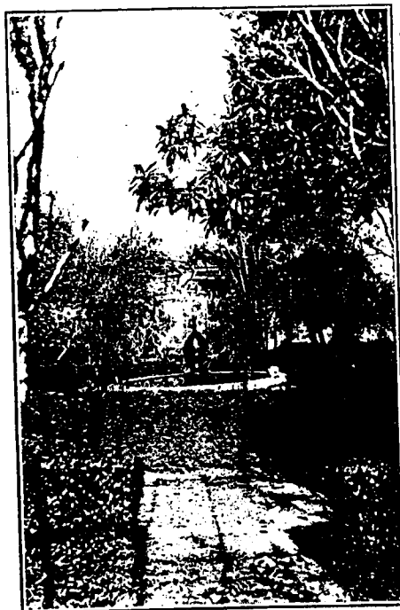
Una vista del PARQUE DE JABALCUZ.

años que han precedido a la guerra, algunos médicos, y principalmente los de Mont Dore, han llamado especialmente la atención sobre este punto delicadísimo de los ambientes termales , que pone de manifiesto cuán compleja es la terapéutica hidromineral, pero al mismo tiempo cuán interesante y preciosa. Además, un agua mineral — dice el citado Dr. Arbinet — reúne elementos variables, agrupados de una manera móvil; es decir, constantemente transformables; todos sus cuerpos representan iones, positivos o negativos, que pasan de lo uno a lo otro en combinaciones incesantemente variables; a estas moléculas vienen a juntarse, bajo la forma coloidal, cuerpos mucho más numerosos, en los que no se pensaba antes y susceptibles de operar modificaciones en el dinamismo terapéutico del agua mineral, que viene a representar un ser viviente, que nada tiene de comparable con la solución que puede obtenerse en un recipiente mezclando las mismas sales que el análisis descubre en su composición química.